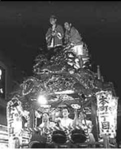
20台もの山車が吉原に集結する。 社・元宿旧海道て能て祭りが、 元神吉道道のもが受な形

天王祭(おてんのひやま)がやってくる 「吉原祇園祭」は通 きた祭だ。 この祭は京都の祇園 呼ばれ、250年余 祭の流れを汲み、悪霊 りに渡って親しまれて や疫病を退散させる祈