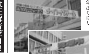
吉原商店街の南北のアーケードに跨がるビッグな横断幕が、3年ぶりにリニューアル。

SBSテレビ 生放送決定!! 4月からスタートしたばかりのSBSテレビ朝の情報番組「おしゃべりクイズ」の「おしゃべり」に吉原商店街がメイン会場。放送は5月7日(金)午前9時55分から、商店街より生中継! 翌日行われる、第32回よしからナイトバザールの紹介や、お得な商店街情報放送予定、お見逃しなく!!