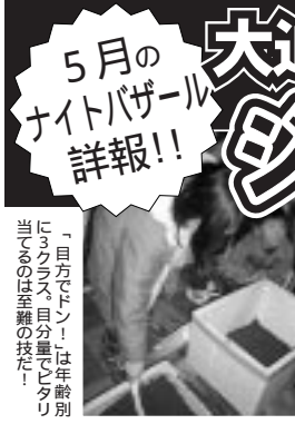
「目方ゲーム」は年齢別に3つのコース、目分量でタリに3つのコースの技術に、