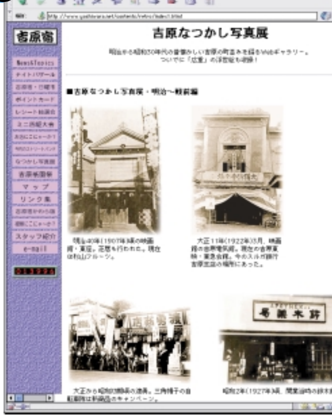
ほぼ毎週更新中! Javaスクリプト等多用しているため、ブラウザは最新のバージョンから見てほしい!