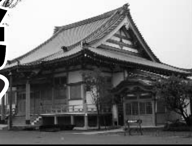
本格的木造建築の荘厳な本堂は、吉原地区の新たなランドマーク。