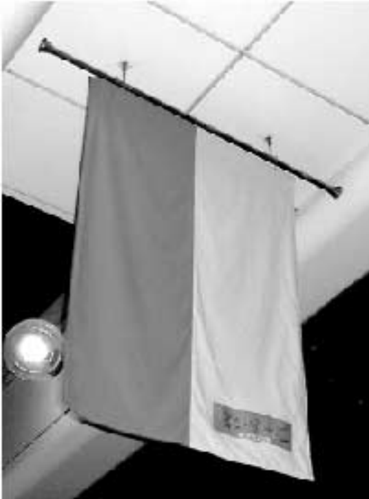
「タペストリー」は「赤・黄」と「茶・オリーブ」のシックな配色の2種類。サイズは高さ1メートル20センチ、幅1メートル。「クリスマス・リース」と共に商店街婦人が製作した手作りだ。

今年、「クリスマス・リース」はさらにパワーアップし、リース中央の松ぼっくりのシンボルも銀色に輝き、吉原商店街のアーケードのポールすべてに134個も飾られる。さらに、先月からア